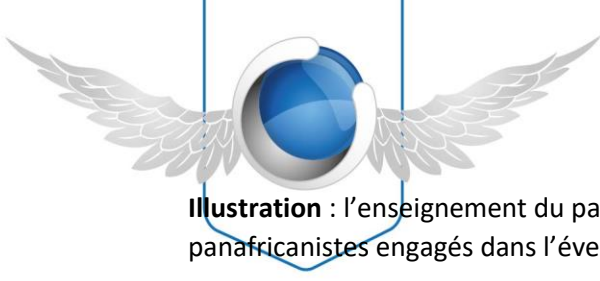
Illustration : l'enseignement du panafricanisme dans les écoles, la mise en place des médias panafricanistes engagés dans l'éveil des consciences.

Arg 3 : La dynamique unioniste est déjà déclenchée à travers la construction des ensembles régionaux et sous régionaux