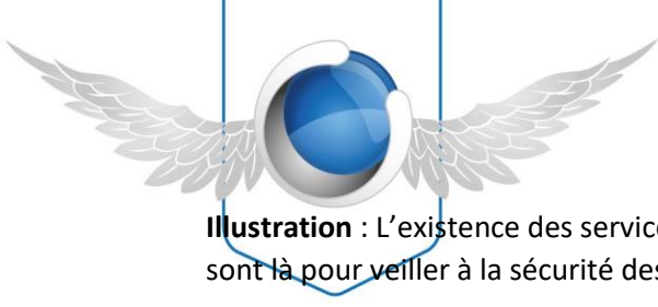
Illustration : L'existence des services de police, de gendarmerie, de la justice, et de renseignements sont là pour veiller à la sécurité des individus.

Argument 2 : l'Etat assure le bien être des citoyens. Il garantit la santé, l'éducation, le logement, l'information à la majeure partie des citoyens