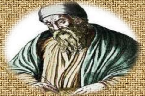
Euclide, Mathématicien grec (IVe-IIIe s. av. J.-E.)