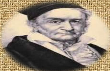
Karl Friedrich GAUSS, Mathématicien Allemand (1777-1855)