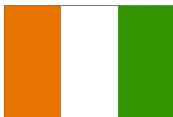
4. LE DRAPEAU

Le drapeau : C'est le tricolore orange – blanc – vert disposé en bandes verticales de dimensions égales à partir de la hampe ou le mat. C'est l'emblème national de la République de Côte d'Ivoire. Son statut d'emblème national est affirmé dans l'article 29 de la Constitution ivoirienne. Il doit flotter dans un endroit visible de tous dans toutes les écoles.