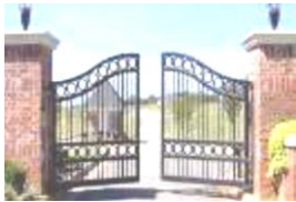
1-..... a gate .....

a restroom – a playground – a staffroom- a gate – a laboratory – a classroom