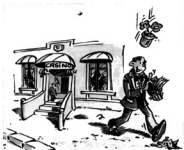
„Je mehr Geld, desto mehr Sorgen.“