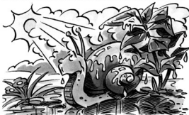
„Auf Regen folgt Sonnenschein!“