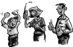
„Die Familie ist über die Nachricht glücklich.“

Ex. : Unser Nachbar ist freundlich zu uns. Notre voisin est aimable avec nous.