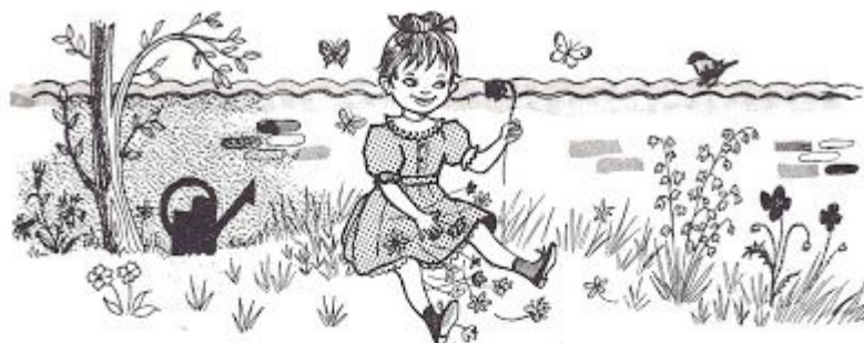
OBSERVONS LE DESSIN * LISONS LE TEXTE : Catherine fait un bouquet (d'après A. France).

Catherine, en cheminant, fait un bouquet. Elle cueille des bleuets, des coquelicots, des boutons d'or. Elle s'assied et ouvre les mains : la moisson fleurie se répand sur elle.