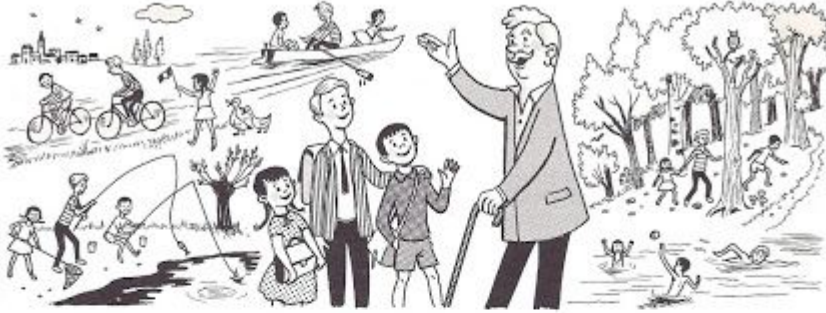
OBSERVONS LE DESSIN * LISONS LE TEXTE : Bientôt les vacances! (d'après M. H. de Miollis).