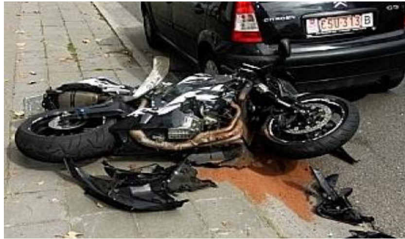
Accidente de una moto con un coche