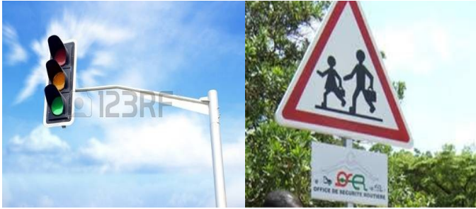
Respetar el semáforo Señal de indicación de una escuela