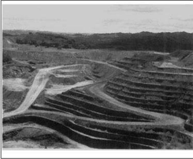
A. EXPLOITATION A CIELOUVERT