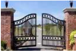
1-..... a gate

a restroom –a playground –a staffroom- a gate – a laboratory– a classroom