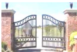
1- a gate .....

a restroom – a playground – a teacher's room - a gate – a science laboratory– a classroom