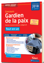
Le Tout-en-un pour une préparation complète

Une collection pour répondre à tous vos besoins