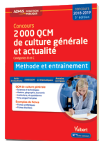
Les Entraînements pour se mettre en condition